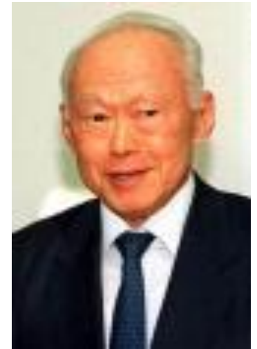
Lee Kuan Yew Senior Minister Singapore