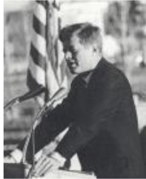
John F. Kennedy

To have a man on the moon by the end of the decade.