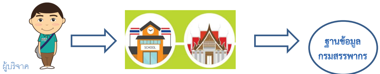
ผู้บริจาค

ทั้งนี้ ข้อมูลการบริจาคผ่านธนาคารที่ธนาคารจะสามารถนำส่งข้อมูลให้กรมสรรพากรได้ ธนาคารของผู้บริจาคและธนาคารของหน่วยรับบริจาคต้องมีระบบรองรับการส่งข้อมูลให้กรมสรรพากรทั้ง ๒ ฝ่าย หากธนาคารฝ่ายใดฝ่ายหนึ่งไม่มีระบบรองรับการส่งข้อมูลดังกล่าว ผู้บริจาคจะต้องขอหลักฐานการบริจาค เช่น ใบเสร็จรับเงิน หรือ ใบอนุโมทนาบัตร จากหน่วยรับบริจาคเพื่อใช้เป็นหลักฐานการลดหย่อนภาษีต่อไป